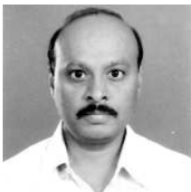
- నిర్వహణ మధురాంతకం నరేంద్ర

అయితే తిరుపతినే నేపథ్యంగా స్వీకరించిన కథలు కొన్ని వున్నాయి. ఈ ప్రాంతంలో పుట్టుకొచ్చిన కథకులు చాలా మంది ఈ ప్రాంతపు నేపథ్యంలో చాలా కథలు రాశారు. ఈ కథలన్నింటినీ చదివేటప్పుడు తిరుపతిలో గత శతాబ్ది కాలంగా వచ్చిన మార్పులంతా మనకు బోధపడుతాయి. ఈ కథల్లో ఆయా రచయితలు చర్చించిన అంశాలు వేరయినా నేపథ్యం మాత్రం తిరుపతే! అందుకే వీటిని "తిరుపతి కథలు" అని పిలుస్తున్నాం.